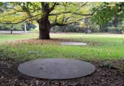
Abbildung links: Richard Serra, Elevational Circles: In/On, 1972-77, 2 runde Stahlplatten, Durchmesser 295 cm, Stärke 7 cm, Standort: Park von Haus Weitmar

WESTFÄLISCHE WILHELMS-UNIVERSITÄT MÜNSTER