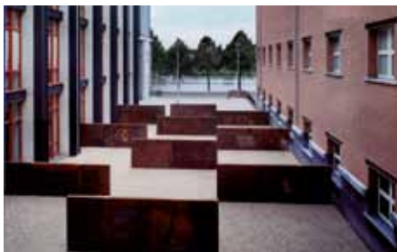
Abbildung rechts: Richard Serra, The Hours of the Day , 1990, Standort: Bonnefantenmuseum Maastricht

Im Zentrum steht dabei die Frage nach den spezifischen Bezugsverhältnissen einzelner Skulpturen zu ihren Standorten. Welchen Änderungen und Neubewertungen unterliegen solche Bezugsverhältnisse im Laufe der Zeit? Welche Konsequenzen ergeben sich aus den fluiden Strukturen der heutigen Lebenswelt für historische und zeitgenössische Konzeptionen von Kunst im Außenraum? Welche Rolle übernehmen Kunstwerke bei der Gestaltung von Öffentlichkeit angesichts des Schwindens öffentlicher Sphären in urbanen Räumen? Entstehen durch die Eigengesetzlichkeit künstlerischer Ortsbezüge oder einer Situationsspezifität (König) potenzielle „counter-environments“ (Marshall McLuhan), die jenseits der ökonomischen eine gesellschaftliche Relevanz durch die Schaffung von Erfahrungsräumen anderer Ordnung entfalten? Welche Herausforderungen stellen sich Institutionen und KünstlerInnen, wenn Umplatzierungen von Kunstwerken im Zuge städtebaulicher, kulturpolitischer oder konservatorischer Veränderungen gefordert sind? Und wie wirken sich soziokulturelle Umbrüche, ökonomische